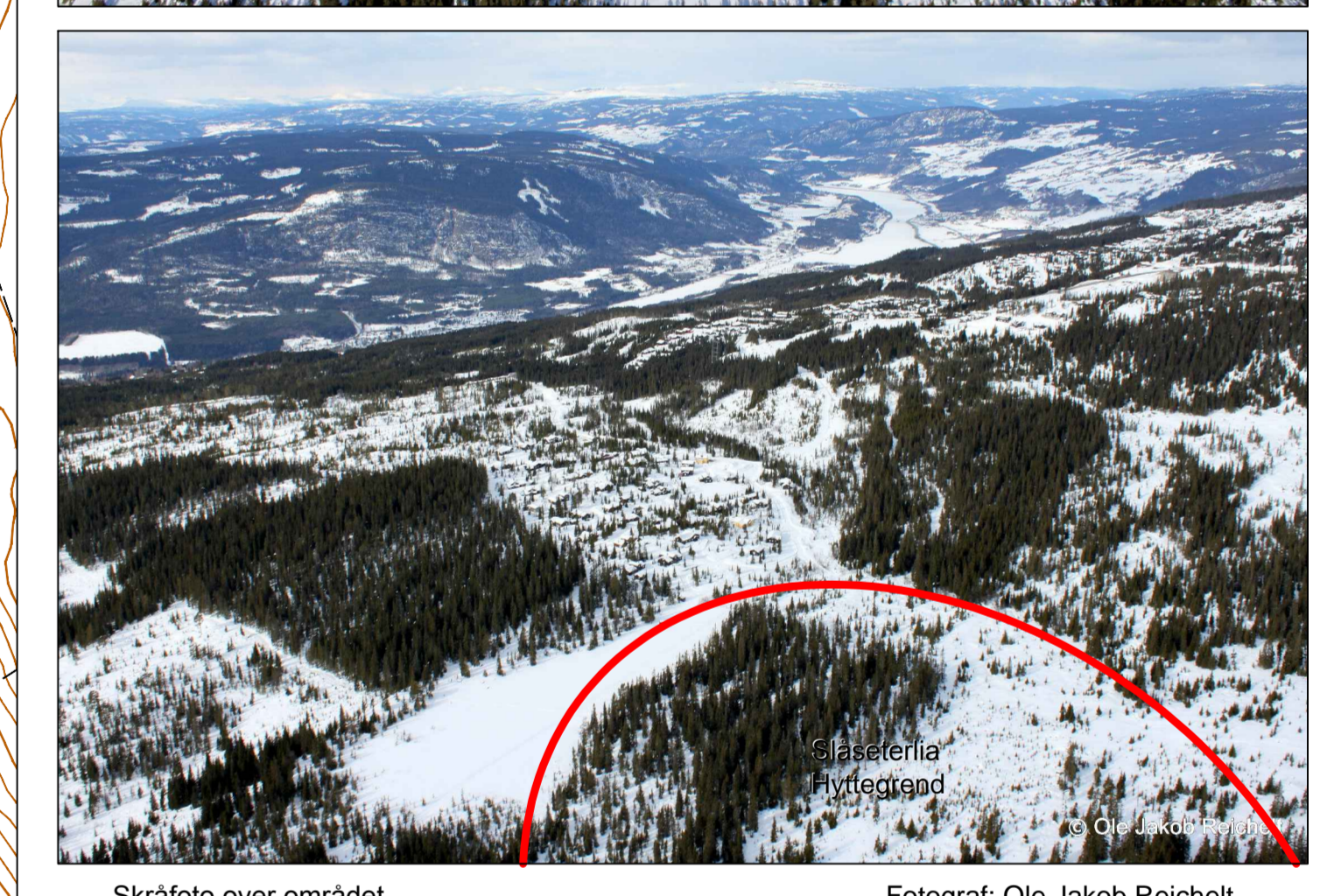
Skråfoto over området